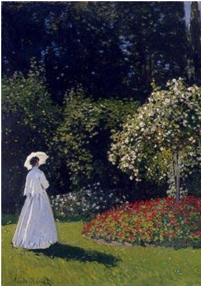
Claude Monet, Vrouw in een tuin (deels) , 1867, 82,3 x 101,5 cm.

(vanaf 29 september ook een collectie van het Van Gogh-museum)