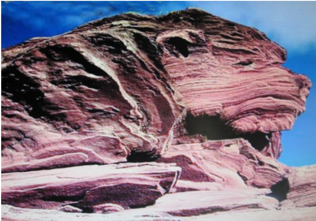
Deze rots lijkt op een huisdier

We zijn nu druk bezig met het thema huisdieren en het is een lust om te zien wat er allemaal geschilderd wordt.